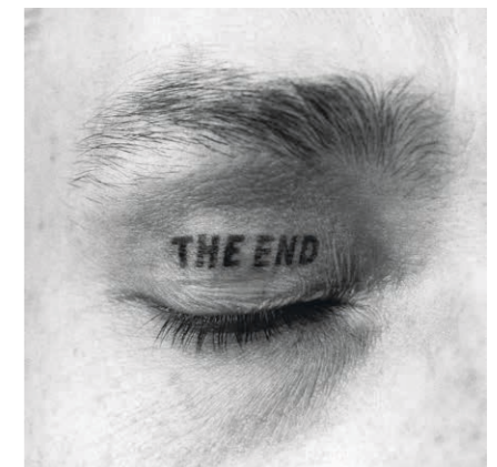
Timm Ulrichs, THE END , 1970/1990/1997 © VG Bild-Kunst, Bonn 2020, Courtesy the artist