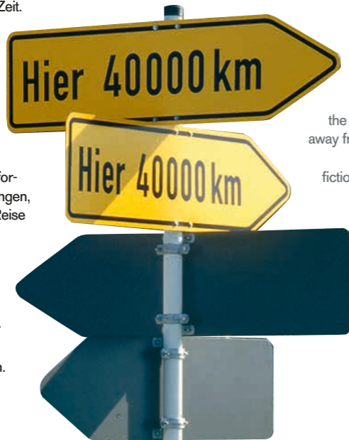
Timm Ulrichs, Wegweiser „Hier 40 000 km“ , 1969/2020, © VG Bild-Kunst, Bonn 2020, Foto: Markus Dollenbacher, Stuttgart

Die Ausstellung präsentiert in fünf Themenrouten rund 100 Werke von über 60 Künstler*innen. Die Auswahl reicht von den 1960er-Jahren bis in die Gegenwart. Gezeigt werden Kunstwerke der Sammlung Ludwig, nationale und internationale Leihgaben sowie Werke, die erst vor Ort entstehen. Mit Malerei, Installationen, Videos, Objekten, Fotografien und Grafiken vermittelt die Ausstellung die Faszination und Bedeutung von Reisen in der zeitgenössischen Kunst.