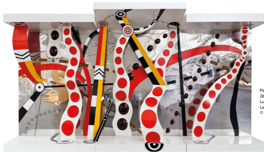
Peter Brüning, Straßenwand , 1968, Ludwig Forum für Internationale Kunst Aachen, Leihgabe der Peter und Irene Ludwig Stiftung, © VG Bild-Kunst, Bonn 2020, Foto: Carl Brunn