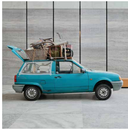
Manaf Halbouni, Nowhere is Home , 2016, © VG Bild-Kunst, Bonn 2020, Courtesy the artist and Zilberman, Istanbul/Berlin, Foto: Manaf Halbouni